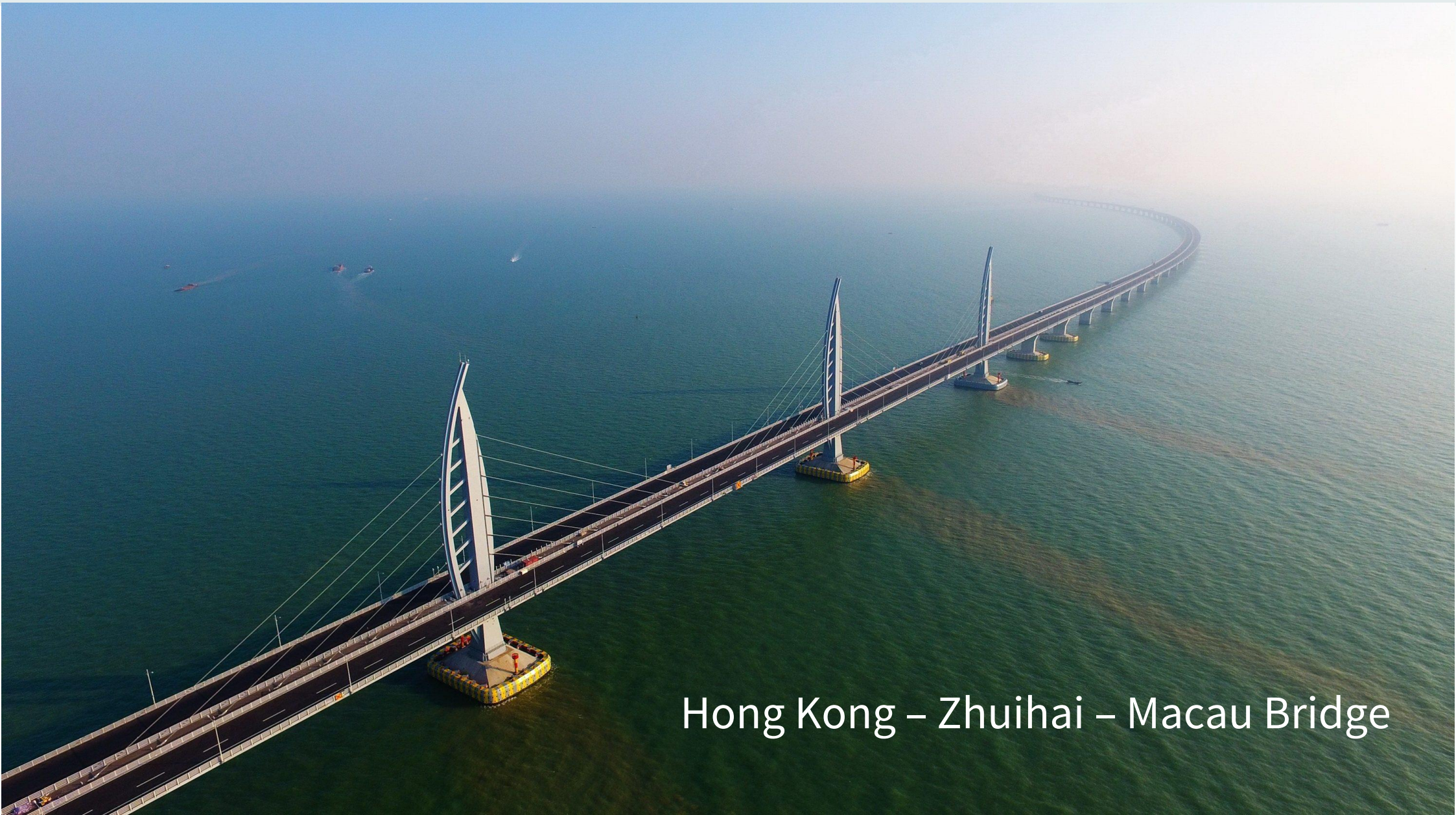
Hong Kong – Zhuhai – Macau Bridge